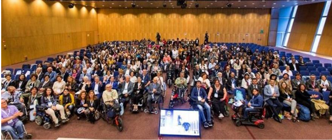
Foto de família del I Congrés sobre el dret a l'autonomia personal: discapacitat física i orgànica, envelliment i cronicitat